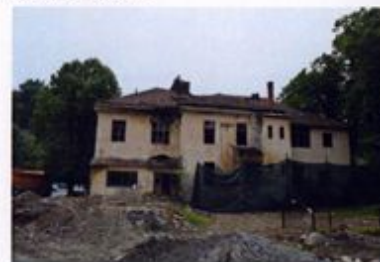
Figură 4.6 Clădirea UFET (corpul clădirii parter, fost depozit UFET, în prezent demolat)