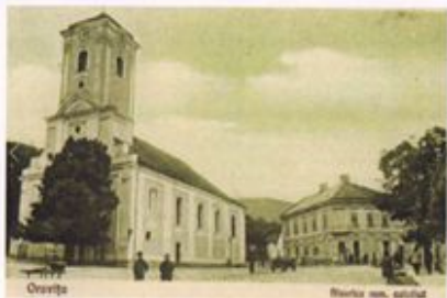
Figură 4.8 Biserica rom.-catolică, ~1900 3