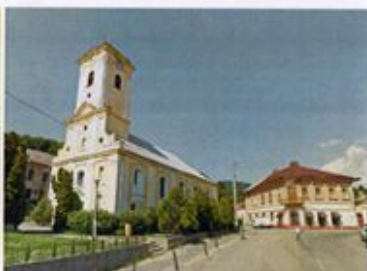
Figură 4.9 Biserica romano-catolică, ~2012

De asemenea, spațiul public este influențat într-o măsură relevantă de principala cale de acces în zonă, respectiv traseul drumului DN 57B de pe latura sudică a Pieței Revoluției.