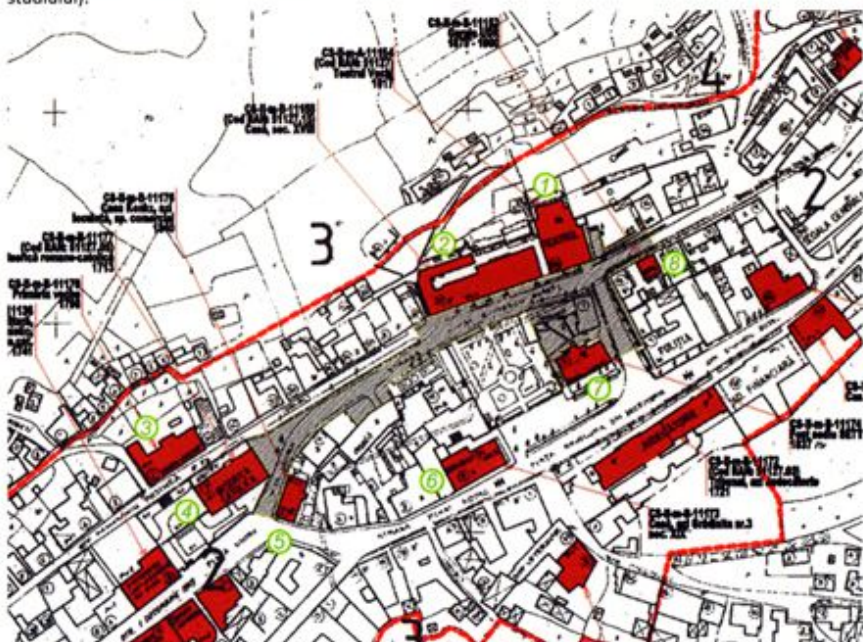
Figură 2.1 Extras din PUZ - planșa cu poziționarea monumentelor istorice clasate prin LMI 2015 în relație cu suprafața efectivă tratată prin PUZ

Localizarea obiectivelor pe hartă – extras PUZ (cu hașură este marcată zona care face obiectul studiului):