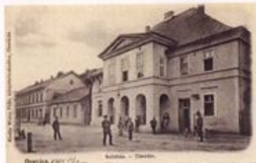
Figură 4.2 Teatrul Vechi, 1905 2