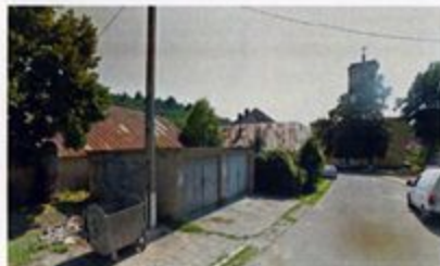
Figură 4.16 Garajele de pe str. M. Eminescu

deși valoarea lor ambientală și arhitecturală este nulă iar prezența lor produce o degradare vizuală și spațială a calității caracterului urban istoric al zonei.