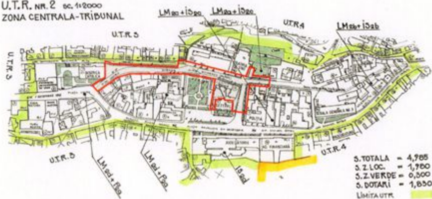
Figură 4.1 Extras din PUG Oravița cu marcarea zonei studiate în raport cu UTR 2

U.T.R. NR. 2 sc. 1+2000 ZONA CENTRALA-TRIBUNAL