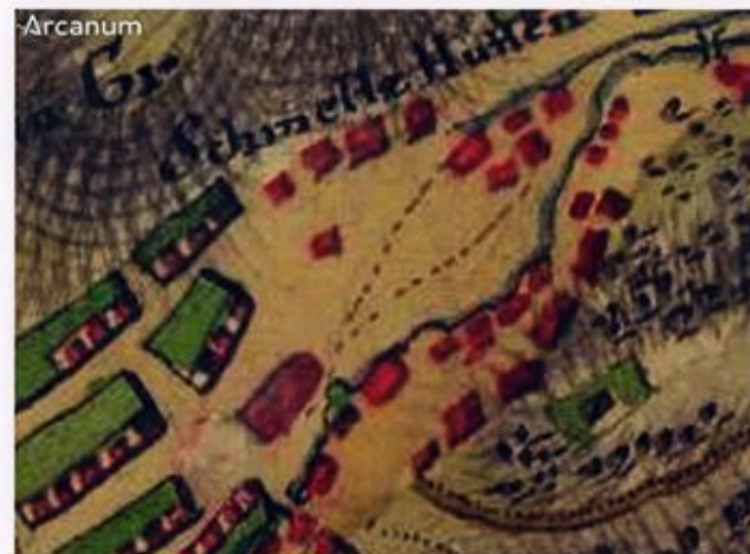
Figură 4.12 Prima Ridicare Josefină (1763-1787) 4

De asemenea, din structura principală binară de căi longitudinale se ramifică legături variate cu zonele mai înalte ale versanților văii, care au permis construcția pe pantă (străzile Damaschin Bojincă, Ciclovei, Islazului, etc.). Aceste străzi ascendente urmăresc fie traseul unor văi perpendiculare pe valea principală, fie curbe de nivel.