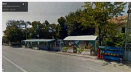
Figură 4.17 Spații comerciale în cadrul pieței

Cea mai recentă transformare în țesutul urban o reprezintă demolarea clădirii de vis-a-vis de teatru (fost depozit UFET), aceasta aflându-se pentru mult timp într-o stare de degradare extremă. Demolarea ei a avut loc în 2015, în urma autorizație de demolare A.D. nr. 28/21.10.2014, fiind inclusiv recomandată de Planul Urbanistic General încă în vigoare, care stipula necesitatea degajării „scurului din fața teatrului - prin demolarea clădirii depozit UFET și completarea plantației de aliniament pe str. Eminescu și Piața Revoluției”. Prin eliberarea spațiului de sub construcție și includerea acestuia în zona de spațiu public care urmează a fi amenajat prin actualul PUZ, spațiul urban din fața teatrului înregistrează un câștig deosebit.