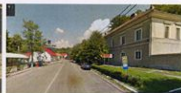
Figură 4.11 Frontul estic, actuala judecătorie (fostul tribunal) ~2012