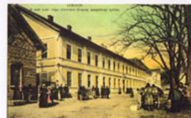
Figură 4.4 Sediul consiliului administrației de stat al companiei feroviare (Casă sec. XVIII cf. LMI), 1908 1