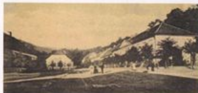
Figură 4.10 Frontul estic al pieței Revoluției, clădirea tribunalului în dreapta, ~1900

De asemenea, spațiul public este influențat într-o măsură relevantă de principala cale de acces în zonă, respectiv traseul drumului DN 57B de pe latura sudică a Pieței Revoluției.