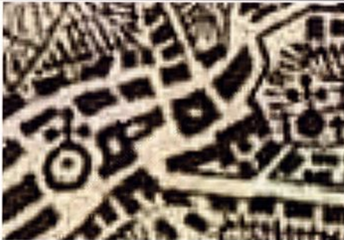
Figură 4.14 A treia Ridicare Josefină (1869-1887) 1