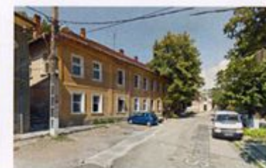
Figură 4.5 Frontul nordic al străzii Mihai Eminescu, ~2012

În vecinătatea vestică a teatrului se află o clădire identificată prin LMI drept „casă” de secol XVIII. Din documentația fotografică existentă deducem că acest imobil a avut inițial funcțiunea de Sediul al consiliului administrației companiei de stat feroviare (conform înscrisurilor existente în vederea din fig. 4.4.), fiind extins după începutul secolului trecut pe ambele laturi, concluzie rezultată în urma studiului comparativ al imaginilor. Astfel, fig 4.2-4.3: indică la fațada estică demolarea imobilului parter dintre acest corp și teatru, existent în anul 1905 și ocupat de corpul P+1 rezultat al extinderii, și fig. 4.4-4.5: indică la fațada vestică o rezolvare cu fronton și ulterior, în urma extinderii, cu șarpantă (însoțită de lipsa clădirii de piatră cu fronton către stradă).