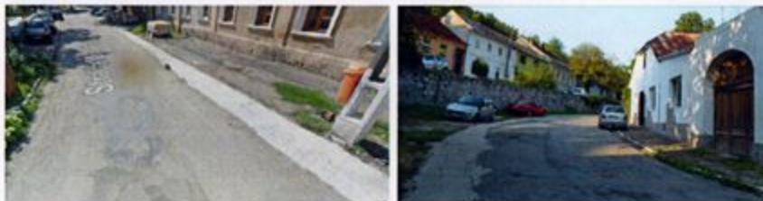
Figură 5.1 Detaliu carosabil și trotuar, strada Mihai Eminescu

Suprafața carosabilă inclusă în prevederile PUZ se prezintă într-o stare fizică proastă, fiind degradată datorită lipsei întreținerii pe o perioadă îndelungată. Atât strada Mihai Eminescu cât și segmentul străzii de legătură dintre DN 57B și aceasta au suprafețe carosabile realizate din asfalt, care este erodat în mod generalizat pe toată suprafața. Trotuarele asfaltate sunt vâlurite și au suprafața de asemenea degradată, iar racordul dintre fațadele imobilelor perimetrale trotuarelor și suprafața trotuarului prezintă lacune importante de material, permițând infiltrații și dezvoltarea de vegetație spontană la baza fațadelor.