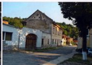
Figură 4.7 Parte din frontul sudic al str. M. Eminescu, 2014