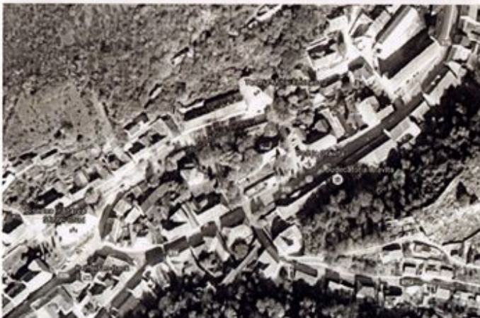
Figură 4.15 Harta orto-foto contemporană 5

Deși hărțile militare austriece folosite în acest studiu vizual evolutiv al țesutului au un grad relativ de aproximare, descriind teritoriul într-un mod generic, din succesiunea lor și din datarea imobilelor individuale din Lista monumentelor istorice se poate desprinde esența evoluției structurii țesutului urban pentru zona de studiu.