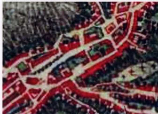
Figură 4.13 A doua Ridicare Josefină (1806-1869) 4