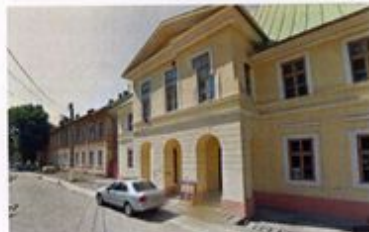
Figură 4.3 Teatrul Mihai Eminescu, ~2012