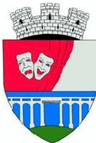
Stem U.A.T. Oravi a

Cele dou m ti i cortina amintesc de activitatea teatral tradi ional , în această localitate aflându-se Teatrul "Mihai Eminescu", cel mai vechi teatru din ar construit în anul 1817 i care ast zi ad poste te Muzeul Culturii C r ene. Viaductul de cale ferat este un element de arhitectur specific acestor locuri. Terasa curbat arat prezen a unui relief colinar, localitatea aflându-se la poalele Mun ilor Aninei. Coroana mural cu trei turnuri crenelate semnific faptul ca localitatea are rangul de ora .